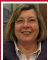
Regina Klinger Platz 4 Bohnsdorf